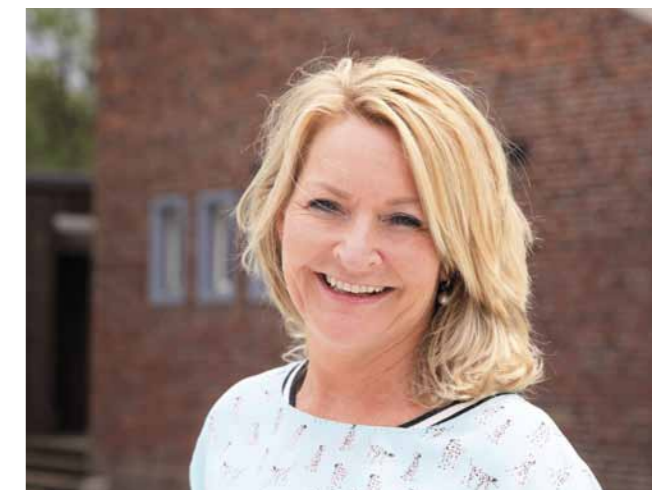
Rian: "We zijn nu ongeveer zover dat we de exploitatie kostendekkend hebben."