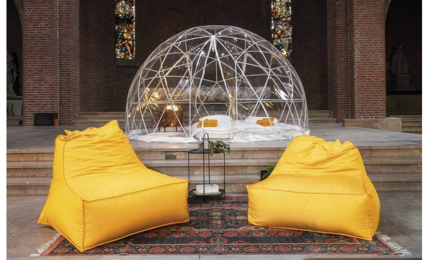
Heilige Nachten creëert een knusse overnachtingsplek in het kerkgebouw zodat mensen zich thuis voelen.

Kijk voor meer info op www.fatimahuis.nl/pierre-weegels-huis/ Mail voor reserveringen naar info@fatimahuis.nl en vermeld daarbij: aanbieding Donatus.